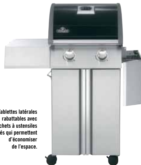
Tablettes latérales rabattables avec crochets à ustensiles intégrés qui permettent d'économiser de l'espace.

Les schémas et les mesures sont à titre de référence seulement. Veuillez consulter votre manuel d'instructions pour obtenir les dimensions exactes. Testé au Canada et aux États-Unis selon les normes CSA C22.2 46/UL1278.