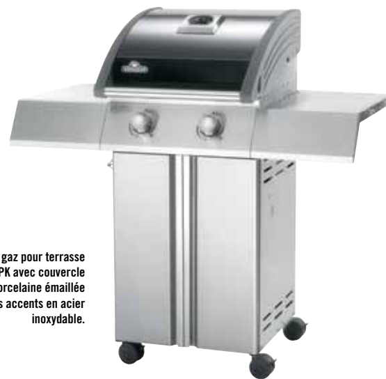
Gril à gaz pour terrasse SE325PK avec couvercle en porcelaine émaillée et des accents en acier inoxydable.