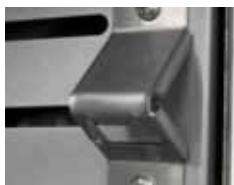
Ouvre-bouteille Ouvre-bouteille situé sur le chariot.