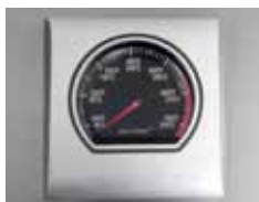
Jauge de température La jauge de température ACCU-PROBE MD permet de contrôler la température de façon précise.